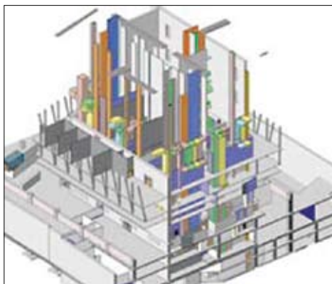
Nekaj faz iz procesa projektiranja

Z uporabo platforme Revit in ostalih orodij Autodesk je bilo skupini, ki dela na projektu Freedom Tower omogočeno naslednje: