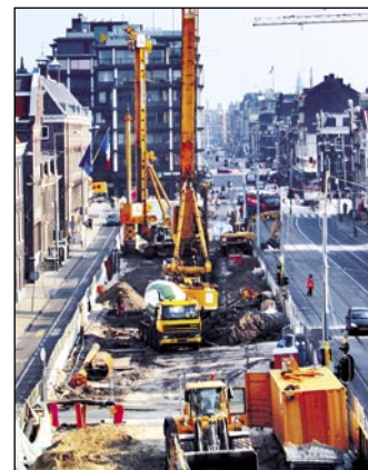
Dela na omejenem prostoru. Postaja Ceintuurbaan