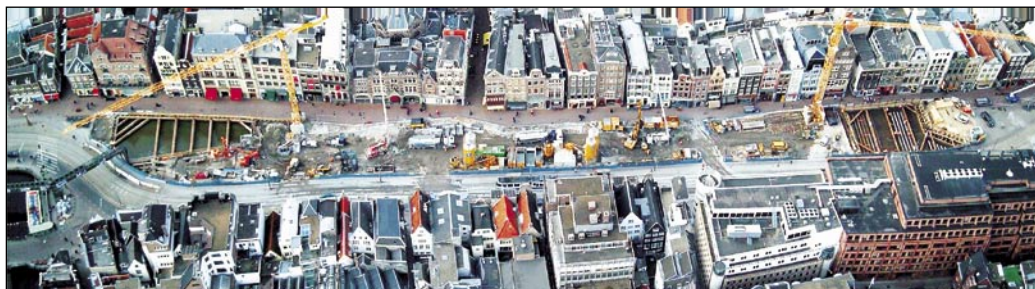
Ptičja perspektiva gradbišča

Novogradnja podzemne železniške proge Noord/Zuidijn v Amsterdamu skozi gosto pozidano in poseljeno staro mesto je izzivalen in kontroverzen projekt predvsem zaradi njegovega vpliva na okolje in ljudi, ki tam živijo. Podjetje Max Bögl je dobilo naročilo za tri od osmih