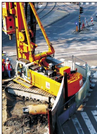
Dela na postaji Ceintuurbaan

Te posebnosti so podjetje Max Bögl gnale, da poveže načrt poteka del s 3D-modelom zasnove. Rezultat je bil zelo kompleksen 4D-model, ki vsem gradbenim elementom priredi potrebne delovne procese z začetno in končno točko. Na ta način lahko simuliramo in vizualiziramo faze dela. S tem postanejo te-