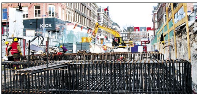
Gradbišče postaje podzemne železnice Rokin

Projekt gradnje podzemne železnice skozi osrčje zgodovinskega središča Amsterdama je za nosilca projekta, podjetje Max Bögl, pomenil pomembno izkušnjo in še mnogo boljše referenco. Pod-